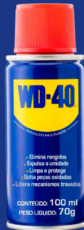
Compacta 100ml Aerossol