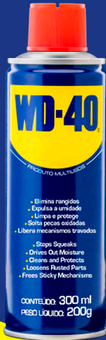
Tradicional 300ml Aerossol