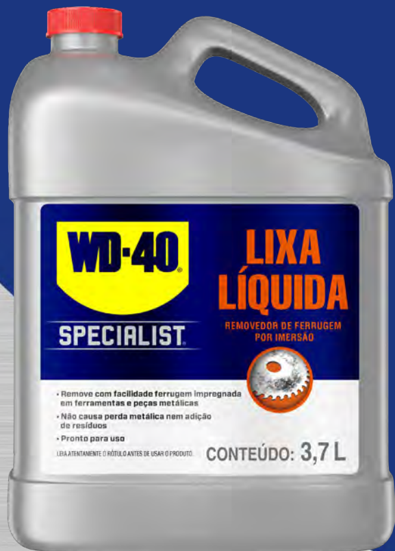
Embalagem Galão 3,7 Litros

Removedor de ferrugem por imersão. Remove ferrugem e restaura peças metálicas complexas, agindo na peça por imersão e atingindo partes de difícil acesso.